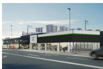
ABVV entre dans le réseau Skoda